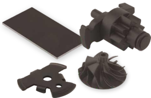
Exemplos de produtos revestidos com TriboShield®