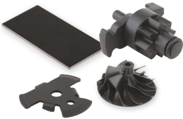
Ejemplos de productos recubiertos con Triboshield®