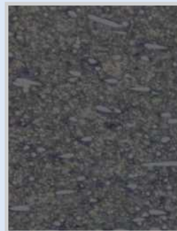
PA6.6T + Festschmierstoff + Füllstoffe