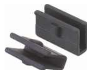
Endklammern für Schaltgabeln