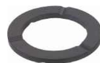
Scheiben für bidirektionale Leitspindeln